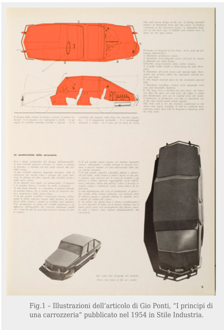
Fig.1 - Illustrazioni dell'articolo di Gio Ponti, "I principi di una carrozzeria" pubblicato nel 1954 in Stile Industria.

Per mezzo di una rappresentazione grafica, accompagnata da una illustrazione verbale particolareggiata e didascalica, si delinea il prototipo e se ne teorizza l'utilità; oppure, dopo il compimento della fase produttiva, s'illustra il prodotto, mettendo in evidenza e con parole e con fotografie (e/o disegni) il suo valore, sia funzionale sia estetico. La scrittura del tecnico e progettista riprende gli stilemi propri della letteratura didascalica[11] allo scopo di visualizzare gli oggetti, descrivere efficacemente il loro funzionamento e illustrarne il peso estetico. Incentrata sul ruolo guida della progettazione, la rivista diretta da Alberto Rosselli sancisce i principi fondanti dell' industrial design , anche attraverso la nobilitazione letteraria dei prodotti, non di rado affidata all' ecfrasis . Nel confronto di due modelli di spillatrici, "cucitrici per ufficio", messe in evidenza dal direttore nel primo editoriale – a cui segue nello stesso numero l'intervento programmatico di Max Bill (1954) – così come nella descrizione