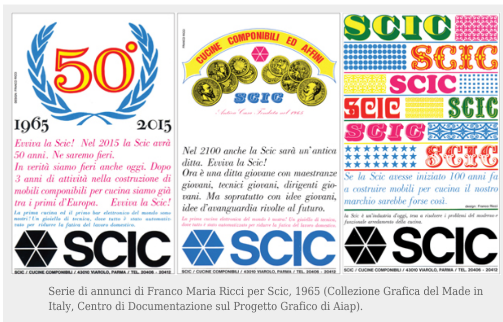
Serie di annunci di Franco Maria Ricci per Scic, 1965 (Collezione Grafica del Made in Italy, Centro di Documentazione sul Progetto Grafico di Aiap).