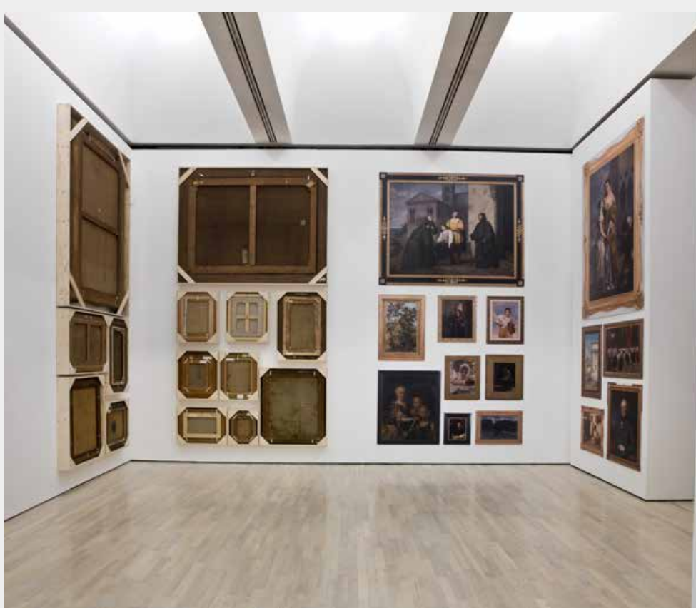
Paco Cao, Invertito , bozzetto site-specific realizzato in occasione della mostra La magnifica ossessione .