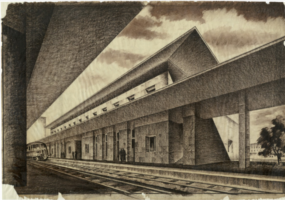
Angiolo Mazzoni, disegno per il progetto della stazione ferroviaria e marittima di Messina, 1937-1940, carboncino su carta da lucido, 680 x 980 mm.