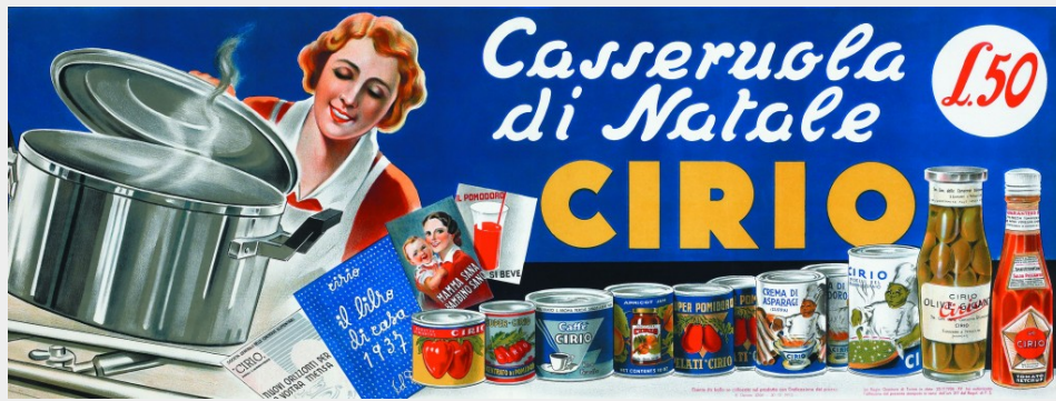
Annuncio pubblicitario Cirio, 1937

A partire dal secondo dopoguerra, a fianco dei prodotti modernisti, si avvia l'ideazione di artefatti rispondenti alle differenti condizioni di vita, derivate dall'assunzione sempre più manifesta delle logiche stringenti dell'organizzazione economica capitalistica e consumistica. Ciò si traduce nella necessità di ricambio continuo e veloce delle merci che viene alimentata da sempre nuovi prodotti sostenuti da ("scientifici") strumenti di marketing, comunicazione, pubblicità e vendita.