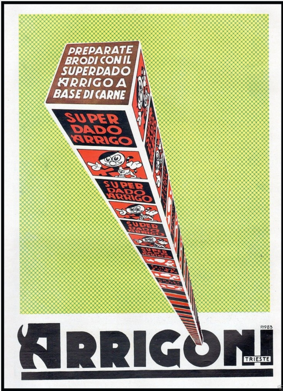
Ufficio propaganda Arrigoni (Mario Cappellato), pagina pubblicitaria Super Dado Arrigo, 1938