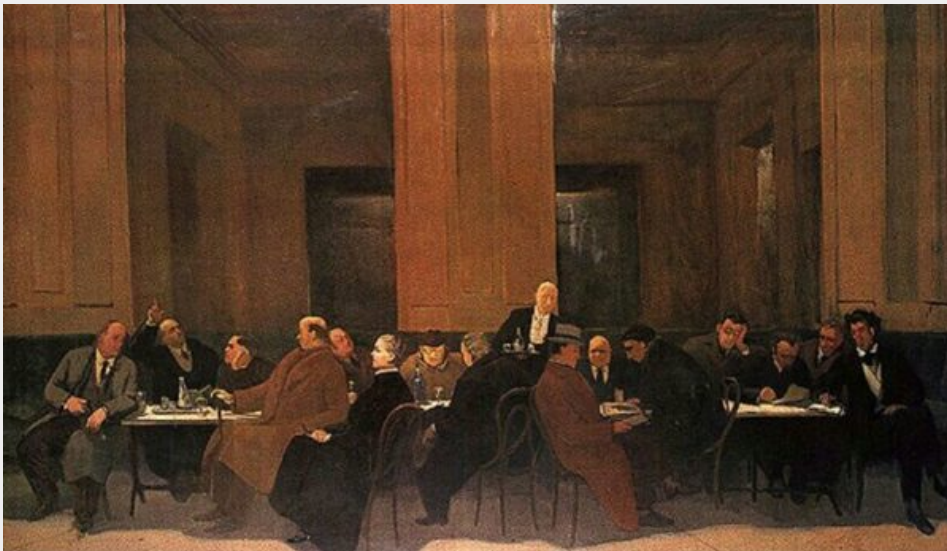
Fig. 4 Amerigo Bartoli, Gli amici del caffè, 1930 - Galleria nazionale di Arte Moderna e Contemporanea, Roma. Disponibile su: https://ediletteraria.wordpress.com - "La Roma di Arnaldo Frateili".

L'idea del vincolo sta dietro l'universo ingegneristico e politecnico di Frateili, sta in questo suo praticantato intellettuale con tutti gli aspetti più razionali della progettazione architettonica ed edilizia. Nel design egli trova la possibilità di una definizione felice di creatività che da folgorazione e percorso, diventa vincolata , ma la forte pratica di studio per gli aspetti razionali del progetto, lo tengono saldamente lontano dalla "pura formalità" del design, cioè dall'interesse per la sola forma e dall'estetica degli artefatti. Essendo partito da una formazione pittorica e figurativa, la trascinazione verso un design prettamente comunicativo, formale e concettuale poteva essere un inciampo facile per Frateili che invece resta ben saldo sulla sua visione pragmatica, lontana dagli esteticismi generati dal 1957 dalla teoria della Gute Form di Max Bill, ma anche dal concetto di arte per l'arte e di creatività generica diventato così attraente dalle avanguardie in poi. Nel suo possente sincretismo culturale di base umanistica, perciò egli "integra l'aspetto puramente figurativo attraverso le tecniche del produrre, l'attenzione al progresso scientifico, l'uso dell'oggetto nella società e la storia della sua immagine nel tempo" (Crachi, 2001, p. 11) senza dimenticare mai la raffinatezza e l'eleganza con cui si era - ed era stato - educato sin da piccolo (fig.4).