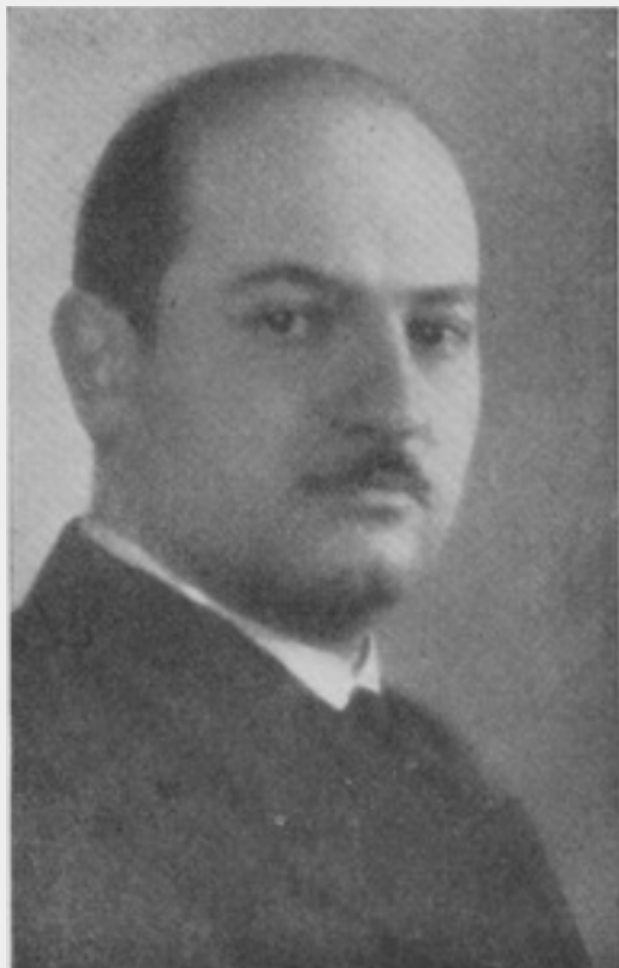
Fig. 3 Ritratto di Cipriano Efsio Oppo. In Emporium , vol. LXX, n. 417, p. 131.

L'educazione e la vicinanza di due uomini così "referenziati" non ci fa dubitare sull'autenticità delle capacità di Enzo che Oppo ancora definisce "un giovane dai doni pittorici non proprio comuni" (cit. in Perreca, p.18)[9]. Dal 1931 al 1946 Frateili continua a dipingere una grande quantità di quadri e di disegni ma, in pratica, la sua attività scema costantemente durante gli anni di studio universitario (Frateili si iscrive nel 1932 alla Facoltà di Architettura di Roma che terminerà nel 1939) per poi cessare del tutto a partire dal 1946. Salvo sporadiche occasioni, infatti, Frateili non si dedicherà mai più all'attività pittorica: da pratica giovanile assidua diviene sporadica in età adulta quando Frateili "ha voluto far rigore al suo interesse figurativo studiando architettura, ha tentato la strada della progettazione, anche socialmente impegnata, trasferendosi là dove già allora (nel primo dopoguerra) le