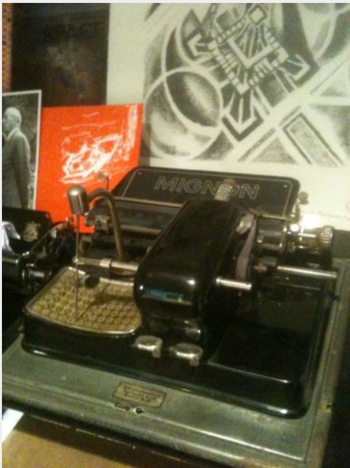
Fig. 2 - Proto-macchina per scrivere Mignon e disegno di avio-pittura