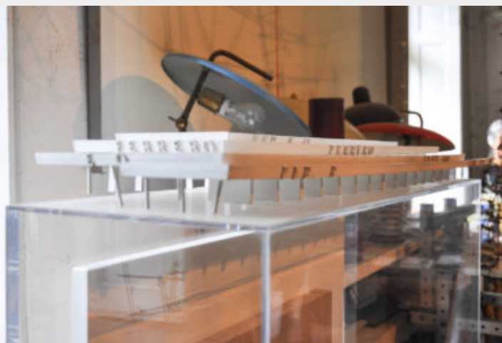
Figg. 6-7 - Particolari di uno dei modelli del prototipo di filiale e magazzini Ferrero Co. In primo piano saggi di sfibratura e piegatura del legno per le produzioni Artek, conservato negli ambienti dell'Istituto Alvar Aalto Museo dell'Architettura e delle Arti Applicate di Pino Torinese

In questo caso, sebbene il progetto rimanga sulla carta, i disegni e i modelli elaborati (in quattro varianti) raggiungono una definizione tale da consentire la chiara visualizzazione della concezione pratica e tecnica alla base della composizione architettonica. Il volume principale è dato da una struttura flessibile e componibile (grazie all'utilizzo di elementi costruttivi prefabbricati) il cui scheletro strutturale è originato dall'accostamento di una serie di portali doppi in calcestruzzo armato che sostengono le piastre di solai frangisole. La pianta invece è utilizzata come criterio ordinatore che compone lo spazio così da consentire la massima semplificazione delle operazioni connesse all'arrivo, all'immagazzinamento e al prelievo dei prodotti.[15]