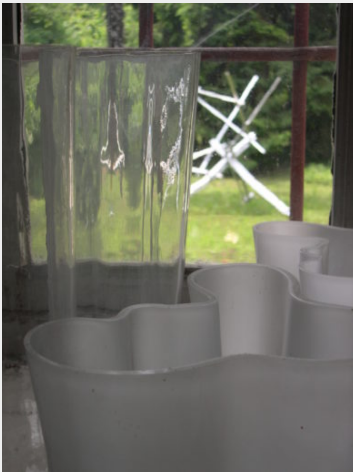
Fig. 5 - Alcuni modelli di vasi "Aalto", anche noti come "Savoy", disegnati da Alvar Aalto nel 1936 per Karhula-Iittala; sullo sfondo strutture luminose opera di Leonardo Mosso nel giardino della Ca' Bianca a Pino Torinese / fotografia T. Marzi.

In particolare, è proprio il ruolo di congiunzione tra Finlandia e Italia acquisito dall'architetto italiano nel decennio compreso tra gli anni cinquanta e sessanta e le conoscenze instaurate da Mosso nell'ambito della collaborazione delle Edizioni di Comunità [9] che nel 1965 inducono Carlo Ludovico Ragghianti a sceglierlo quale curatore della mostra sulla produzione aaltiana (1918-1970) organizzata a Palazzo Strozzi, a Firenze, e del catalogo L'opera di Alvar Aalto (Mosso, 1965). Questo episodio, al pari della mostre dedicate a Wright (1950) e a Le Corbusier (1963), dalla metà del XX secolo riscuote un tale successo da condizionare le scelte progettuali e urbanistiche e innescare un rinnovato interesse per la sua opera e il moltiplicarsi di incarichi nazionali.[10] Nonostante l'interesse suscitato, però, degli otto progetti italiani commissionati ad Aalto, ne verranno realizzati solamente due.[11]