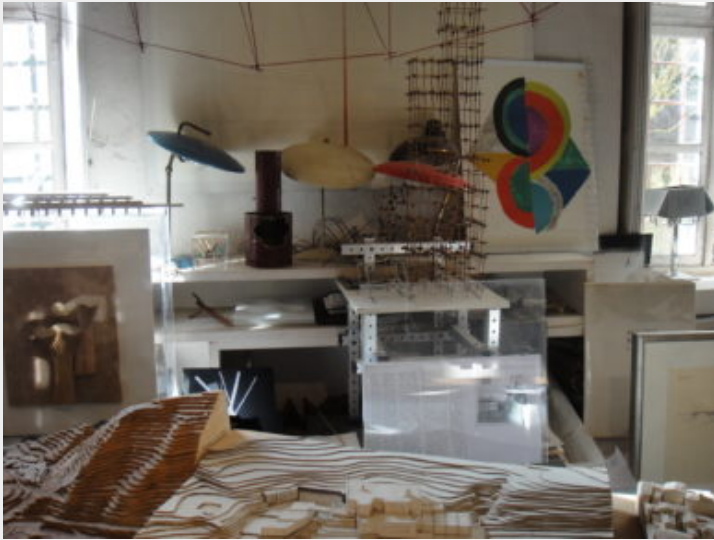
Fig. 8 - In primo piano uno dei modelli di villa Erica, immersa sul colle della Maddalena, conservato presso l'Istituto Alvar Aalto, Pino Torinese, sullo sfondo lampade in metallo di Diulgheroff e Aalto