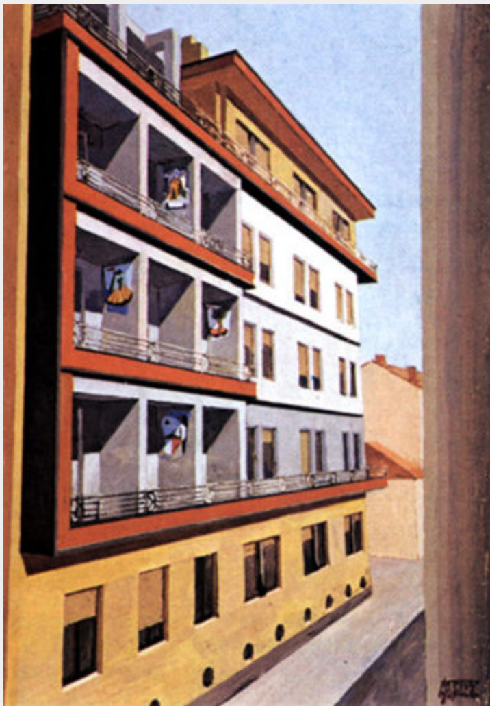
Fig. 11 - Nicola Mosso, Progetto per Casa Cervo a Biella , Veduta prospettica con inserimento delle plastiche murali nelle logge, 1934. Collezione Nicola Mosso, in deposito presso Istituto Alvar Aalto, Pino Torinese.