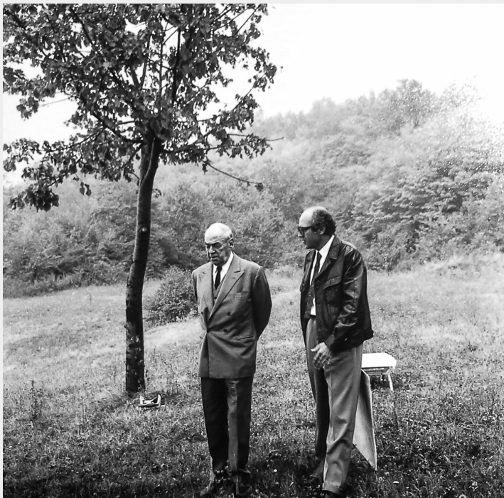
Fig. 4 - Aalto e Leonardo Mosso a Moncalieri durante un sopralluogo sul terreno di villa Erica.

Si deve difatti a Mosso la partecipazione di Aalto a una serie di documentate conferenze a Torino, Genova, Milano e Roma promosse nel 1956 dalle sorelle Antonetto dell'Associazione Culturale Italiana (ACI) che consentono al maestro scandinavo di instaurare un primo proficuo contatto professionale con l'Italia (fig. 4).[8]