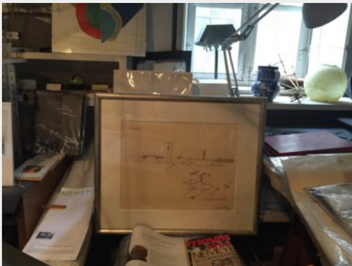
Fig. 3 - Disegni originali, scritti e fotografie di Oscar Niemeyer / fotografia F. Stella.

Tutte le testimonianze sono state raccolte infatti secondo una logica di contaminazione tra progetto, arte e oggetto d'uso tipica tanto dell'indole dei due, quanto della cultura progettuale in cui si formano e operano: entrambi architetti/artisti, Leonardo (1926) esordisce nell'insegnamento alla Facoltà di Architettura del Politecnico di Torino nel 1961, con i corsi di Plastica Ornamentale (Annuari, 1961-1969), Laura (1938), laureata negli stessi anni, si dedica da subito all'attività nelle arti di ricerca. Partendo da questo presupposto e dall'assunto che già negli anni tra le due guerre, in particolare in area torinese, la circolazione tra i diversi linguaggi visivi e progettuali costituisce un fil rouge tipico e incontestabile (Lamberti, 2000), il giacimento conservato presso l'Istituto Alvar Aalto si dispone a una molteplicità di modi di indagine e offre varie chiavi interpretative amplificate dai suoi contenuti, ognuno da mettere ulteriormente in relazione con altri fondi archivistici e con fonti secondarie.