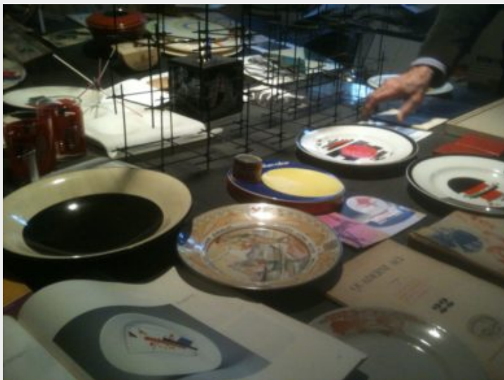
Fig. 13 - Collezione di ceramiche d'uso russe e italiane, anni Venti, conservato negli ambienti dell'Istituto Alvar Aalto Museo dell'Architettura e delle Arti Applicate di Pino Torinese.

La biblioteca dell'Istituto, infine, conta più di 20.000 volumi e numerose raccolte. Si distinguono al suo interno la sezione della "biblioteca finnica", una delle più complete esistenti fuori dalla Finlandia, la sezione sull'architettura popolare, sul costruttivismo internazionale e sulle copertine d'autore e d'artista. Proprio legata a questo ultimo settore ha avuto luogo la mostra L'arte del Novecento e il libro (Castagno & Cavaglià, 2004)[20] (fig. 14) dedicata al lavoro che pittori, scultori, architetti del Novecento, hanno destinato alle copertine di libri, riviste e pubblicazioni. Sono presenti copertine firmate da molti dei protagonisti dei movimenti artistici che hanno segnato le arti del Novecento, dalle avanguardie storiche fino agli sviluppi più attuali dell'arte contemporanea, tra i quali Fausto Melotti, Fernand Léger, Le Corbusier, Max Ernst, Henri Matisse, Carlo Mollino, Alvar Aalto, Gino Severini, Sonia Delaunay, Andy Warhol, Giulio Paolini, Tapio Wirkkala, Reima Pietilä, Bruno Munari, Felice Casorati, Arrigo Lora Totino, Sandro De Alexandris, Nicola Mosso, Leonardo Mosso, Laura Castagno. L'esplicito obiettivo è proporre la realizzazione di una pinacoteca in piccolo formato che copre tutto l'arco del secolo, in una logica di democraticizzazione dell'arte "alta".