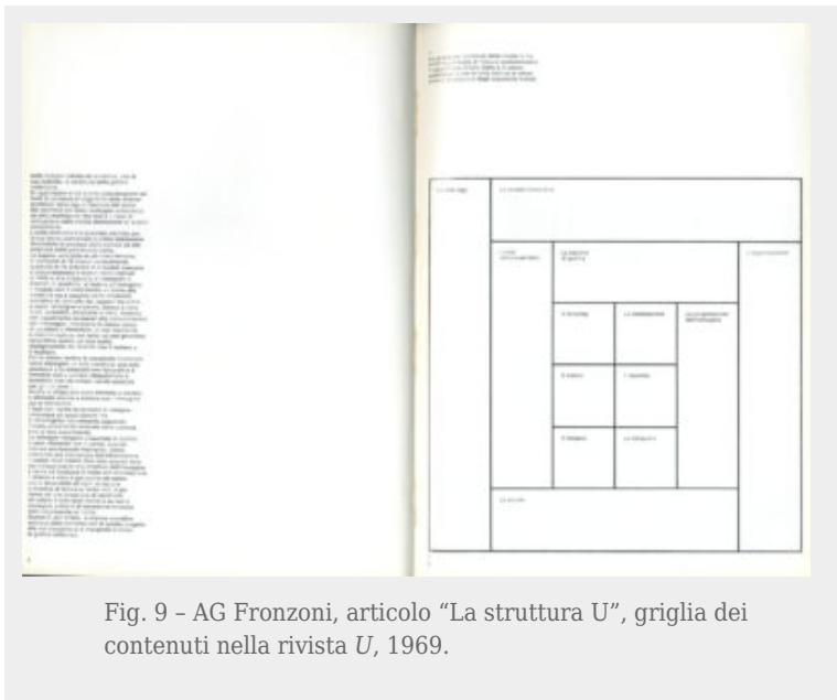
Fig. 9 - AG Fronzoni, articolo "La struttura U", griglia dei contenuti nella rivista U, 1969.

In occasione del lavoro di gruppo con gli studenti però si capisce che governa i contenuti insieme agli studenti e a un gruppo di docenti (Frisia, Perotti, Silvestrini, Tovaglia, Sansoni), sia nell'editoriale sia nell'articolo "La struttura U" (fig. 9), in cui si spiega la linea editoriale e redazionale dei futuri numeri, che si intende come: