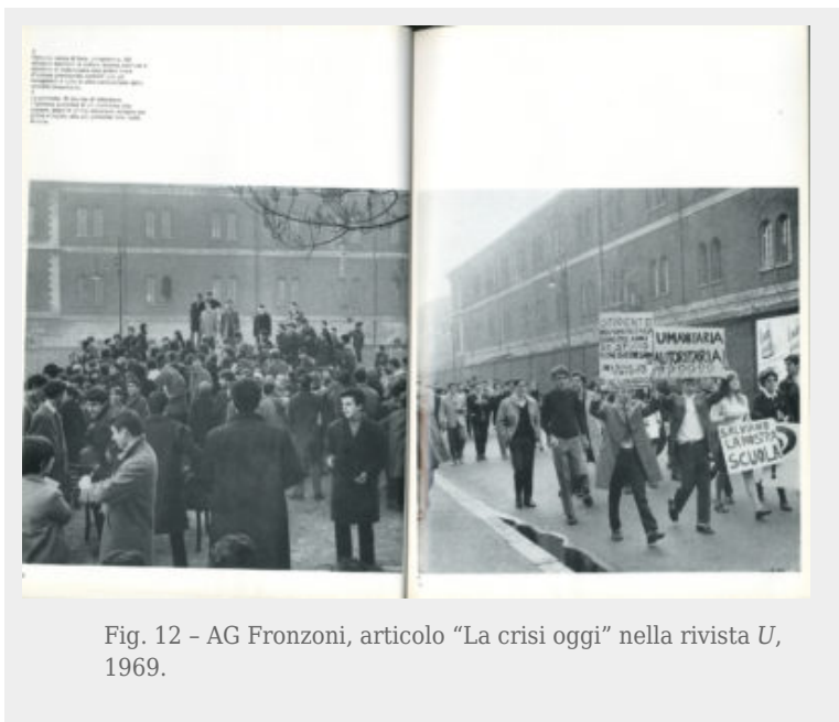
Fig. 12 - AG Fronzoni, articolo "La crisi oggi" nella rivista U , 1969.

La progressiva astrazione nei suoi lavori corrisponde a un incremento della cura del dettaglio, nella semplificazione; polemiche sono sorte per la poca leggibilità di alcuni manifesti affissi, ma noi siamo d'accordo con Lussu quando dice che "l'importante non è leggere velocemente, ma capire bene, cosa ben diversa". Così Fronzoni con il suo riuoso freddo vuole insegnare a "far capire", quello che gli interessa è il processo con il quale i destinatari decifrano la comunicazione, sia gli studenti che i fruitori generici.