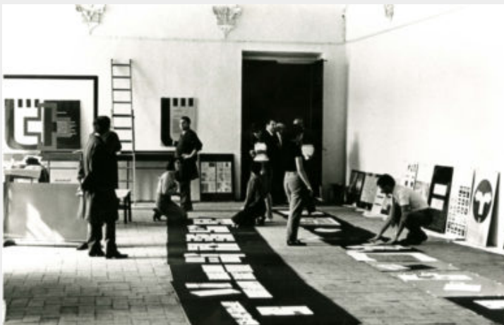
Fig. 3 - Albe Steiner, Mostra Convegno di lavoro Grafica e segnaletica in un centro storico , 1969.

L'immagine del Comune di Urbino è trattata come "un'unità divisibile", il metodo che Steiner adotta è lo "scomporre per poi ricomporre: suddivide l'insieme delle comunicazioni visive in sottoinsiemi" (Anceschi, 1984, p. 14).