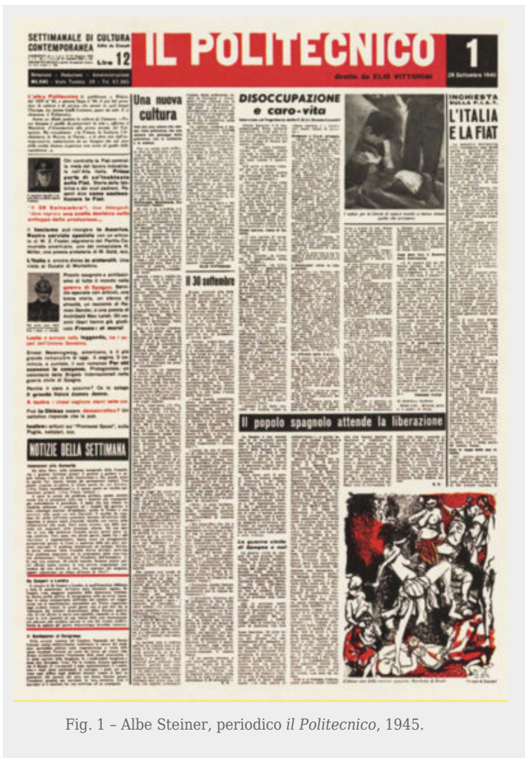
Fig. 1 - Albe Steiner, periodico il Politecnico , 1945.

Nell'ambito dell'editoria sia Steiner, con i citati il Politecnico e Milano Sera , sia Fronzoni, con un periodico meno noto come Punta (fig. 2), si confrontano con strumenti di cultura che presentano analogie di tipo registico, di "formato culturale". Da quelle iniziali messe in scena del primo dopoguerra in contenitori culturali come i periodici, entrambi i progettisti sperimentano ad altre scale: per la grande industria e per l'editoria, negli allestimenti fieristici e nella vetrinistica (Steiner) e in numerosi allestimenti per gallerie d'arte e musei (Fronzoni).