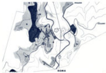
Urbino del Territorio