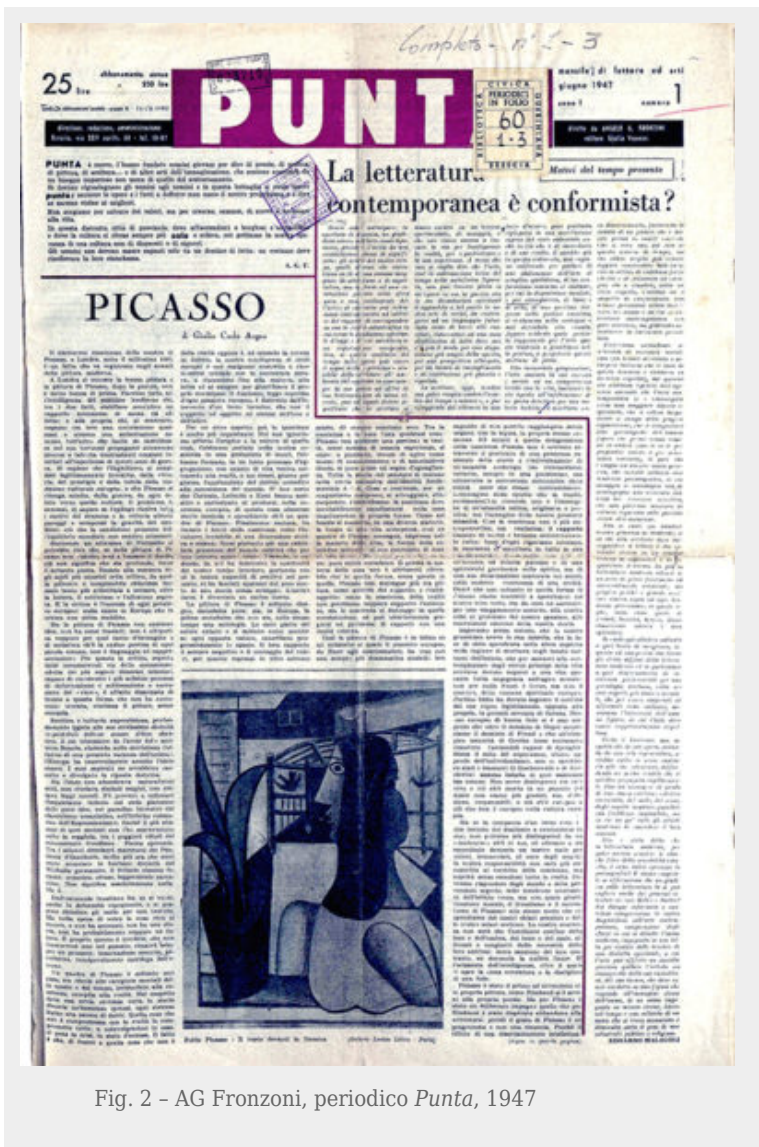
Fig. 2 - AG Fronzoni, periodico Punta , 1947

Ma solo dopo gli anni sessanta entrambi escono da queste committenze tradizionali per confrontarsi attraverso la didattica e il rapporto con gli studenti. I due esperimenti, che in questo saggio prendiamo come casi emblematici, vedono il medium rivista/periodico protagonista applicato alla ricerca didattica portata avanti da entrambi. La rivista U del 1969 e il periodico U di Urbino del 1969, nati entrambi nei luoghi in cui i due grafici praticavano l'insegnamento. L'esperimento didattico della rivista di Fronzoni, scaturito da un esemplare accanimento (studenti Umanitaria-Fronzoni-scuola) rispetto al problema della riqualificazione didattica in un momento critico della scuola Umanitaria, è confrontabile in termini di strategia con lo storicizzato progetto dell'immagine