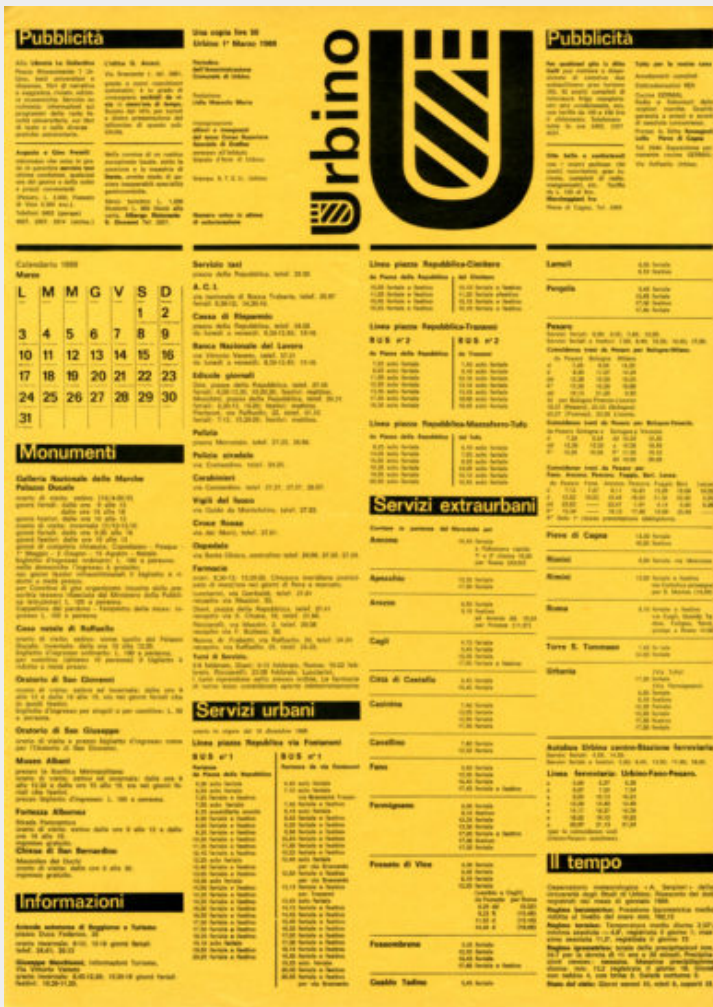
Fig. 5-6-7 - Albe Steiner, giornale U, 1969.

Se Il Politecnico con le sue idee, il contenuto degli articoli, le fotografie e le didascalie era un giornale che nasceva tutto insieme, proprio questa mobilità e questa pratica collettiva del lavoro sui contenuti testuali e visivi, si ripete ad Urbino intorno alla segnaletica prima e al giornale cittadino poi, Steiner cerca una nuova forma di comunicazione grafica, un nuovo “formato culturale” sul quale lui e gli studenti prima, e la cittadinanza poi si possano confrontare. Il coordinamento contenutistico, che dal ridisegno dello stemma si è espanso fino al giornale della città, attraversa tutti i supporti e le tecniche (tipografiche e fotografiche) per raggiungere una narrazione completa di una città storica con un obiettivo doppiamente didattico: verso il pubblico (municipalità e cittadini) che usano gli strumenti di segnaletica ed editoriali (il giornale) e verso gli studenti che nella progettazione - che