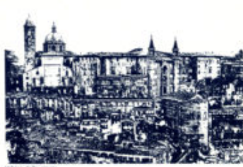
Urbino della piazza