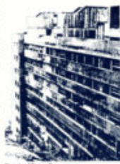
Novi edifici e Possessori