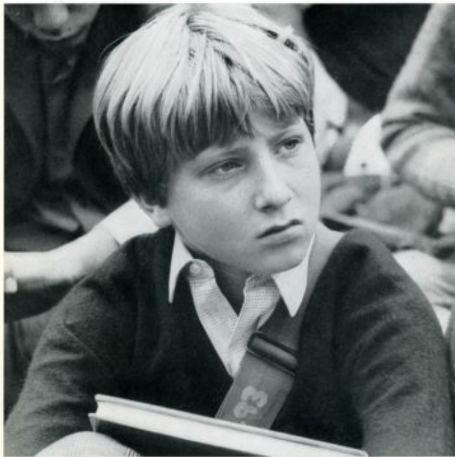
Fig. 8 - AG Fronzoni, copertina numero unico della rivista U , 1969.

L'Umanitaria sin dalla sua fondazione come scuola laboratorio d'arte applicata all'industria, coltivava il gusto secondo l'insegnamento di William Morris e Walter Crane (Decleva, 1993, p. 180), perseguiva l'idea della necessaria formazione personale a trecentosessanta gradi: elevazione dei lavoratori nel campo tecnico e in quello civile, intendendo il lavoro come un momento della crescita individuale e sociale ma sentendo la necessità investire anche in tutte le fasi della vita - non solo quella lavorativa - dagli incontri culturali, all'attività sportiva e ricreativa.