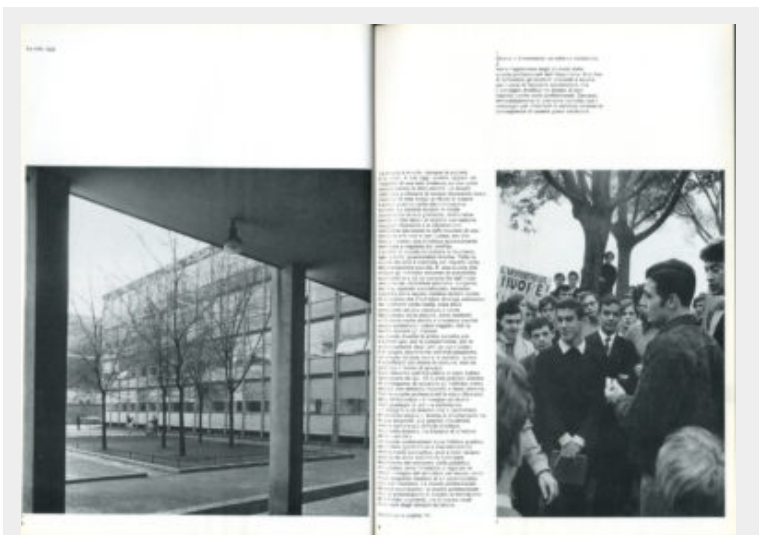
Fig. 11 - AG Fronzoni, articolo “La crisi oggi” nella rivista U , 1969.