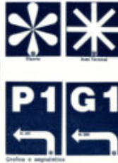
Griglia di segnalazione