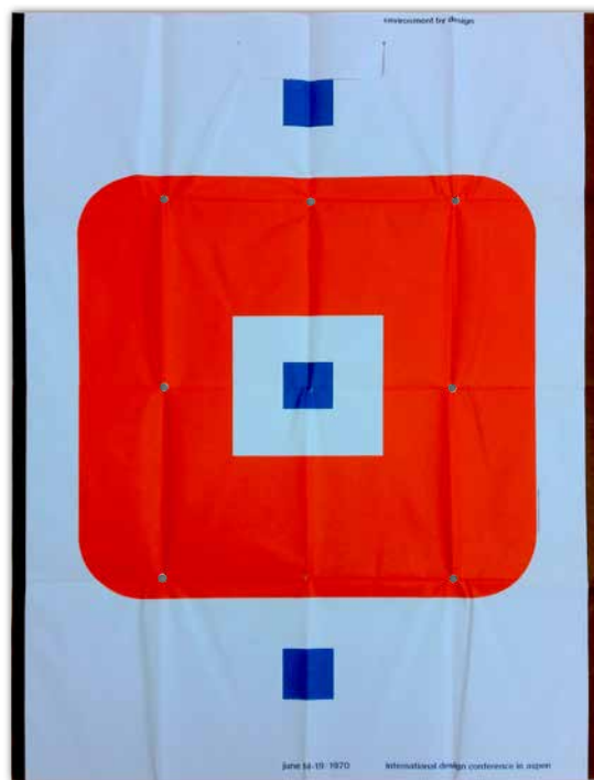
Fig. 5 — Poster-sporta dell’IDCA del 1970, des. John Massey (IDCA Records, 1970)

Come chairman viene scelto William Houseman, in qualità di editor di “The Environment Monthly”, che Eliot Noyes e altri membri del board dell’IDCA ritengono una rivista capace di fornire “un ventaglio ampio e un mix interessante di questioni legate all’ambiente” (IDCA Records, 1970b).