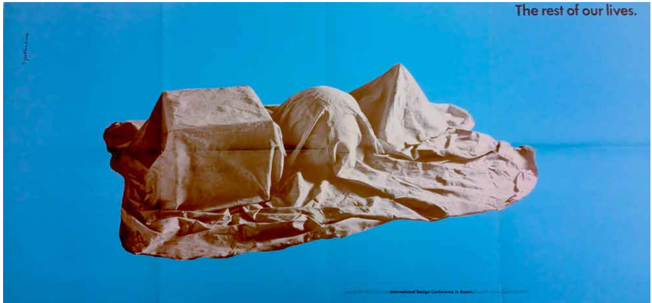
Fig. 4 — Poster dell'IDCA del 1969, des. Tony Palladino (IDCA Records, 1969)

Nell'edizione del 1969, "The Rest of our Lives" (FIG. 4) - che ha luogo un anno dopo la costituzione del Club di Roma, e proprio nell'anno in cui Buckminster Fuller pubblica il suo celebre Operating Manual for Spaceship Earth - una riflessione più o meno approfondita sulla questione ecologica è presente in quasi tutti i contributi dei relatori, e i toni sono decisamente più preoccupati che in precedenza, anche per la coscienza sempre più chiara dell'entità delle sfide a cui dover far fronte.