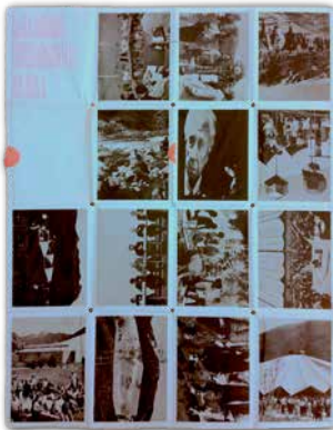
Fig. 6 — Retro del poster-sporta dell'IDCA del 1970 (IDCA Records, 1970)

Continuano in ogni caso ad esserci keynote speakers : su tutti Buckminster Fuller e Papanek, allora collaboratore di Farson al CIA, e invitato come relatore proprio nell'anno in cui veniva pubblicata l'edizione americana del suo Design for the Real World (Papanek, 1971), che sarebbe diventato negli anni una vera e propria pietra miliare per il design ecologically concerned .