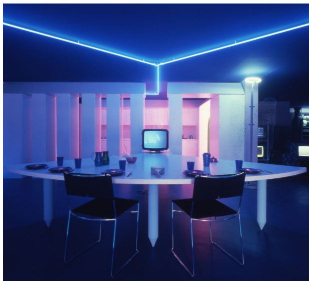
Fig. 2 - "La Casa Telematica", mostra a cura di Gianfranco Bettetini con la collaborazione di Aldo Grasso e Ugo La Pietra. Allestimento di Ugo La Pietra. Fiera di Milano, 1983. Zona pranzo.

È questo l'approccio che ho applicato nella "Casa Telematica": ho introdotto una dose massiccia di strumentazioni creando un "effetto telematico". Dalla luce diffusa "azzurrina", tipica dei locali dove si vede la TV, ai decori delle antine della cucina, alle poltrone non più collocate in modo radiocentrico per la conversazione intorno al tavolino da tè, ma messe in fila una dietro l'altra per poter osservare il monitor collocato nello schienale di ciascuna: la conversazione era ormai tra l'individuo e lo strumento!