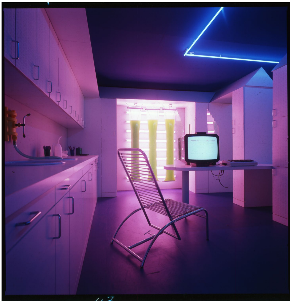
Fig. 3 - "La Casa Telematica", mostra a cura di Gianfranco Bettetini con la collaborazione di Aldo Grasso e Ugo La Pietra. Allestimento di Ugo La Pietra. Fiera di Milano, 1983. Cucina.

Il 40% degli abitanti di Milano ora è single, la famiglia tradizionale si è disgregata, i cittadini preferiscono vivere nella città anziché nelle proprie abitazioni.