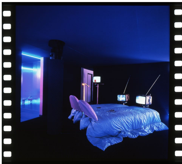
Fig. 1 - "La Casa Telematica", mostra a cura di Gianfranco Bettetini con la collaborazione di Aldo Grasso e Ugo La Pietra. Allestimento di Ugo La Pietra. Fiera di Milano, 1983. Camera da letto. Courtesy Ugo La Pietra.