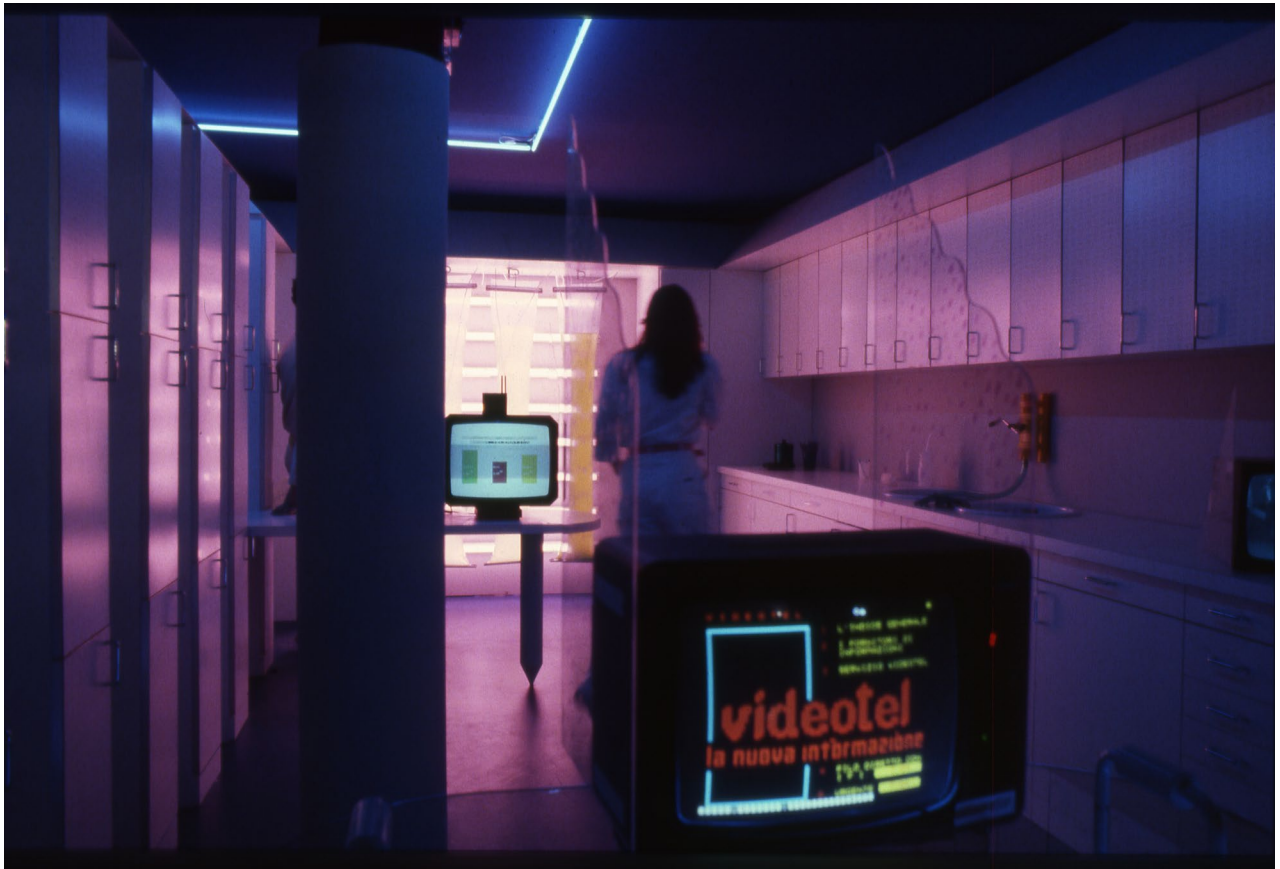
Fig. 4 - "La Casa Telematica", mostra a cura di Gianfranco Bettetini con la collaborazione di Aldo Grasso e Ugo La Pietra. Allestimento di Ugo La Pietra. Fiera di Milano, 1983. Cucina.

"Viviamo affollate solitudini" e ci ritroviamo tutti insieme negli angoli della città, nel rito collettivo della "movida urbana". Il risultato è che la Casa Telematica non può più essere aggiornata rispetto a quel modello del 1983. La Casa Telematica ormai è il nostro cellulare, intorno al quale ritroviamo tutte (o quasi tutte) quelle relazioni tra persone, cose, spazio che un tempo rappresentavano la nostra quotidianità all'interno dello spazio domestico.