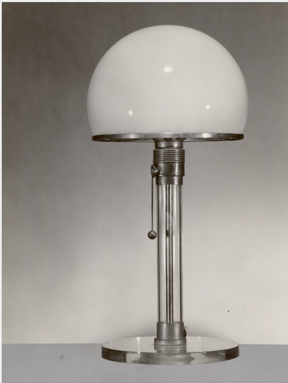
Lucia Moholy, lampada da tavolo, laboratorio del Bauhaus (design di K. J. Jucker e W. Wagenfeld), 1923/24, prova d'autore, vintage, 234 x 174 mm. Collezione Fotostiftung Schweiz, Winterthur.