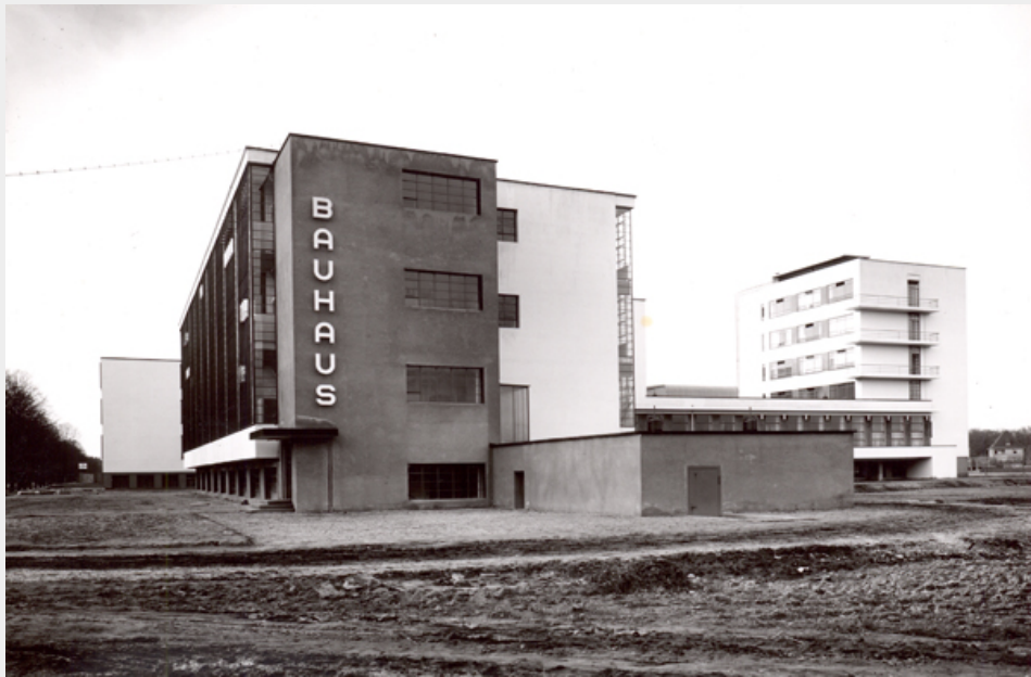
Lucia Moholy, Edificio dei laboratori, ripreso da sud-ovest, 1925/26, prova d'autore, stampa successiva, 143 x 214 mm. Collezione Fotostiftung Schweiz, Winterthur.

Rispetto all'insieme della sua attività professionale - che portò la Moholy, dopo l'esperienza della Bauhaus, a lavorare a Londra e, come fotoreporter, nella Jugoslavia degli anni Trenta - il motivo d'interesse della storia del design per il suo operato consiste nell'apporto - messo utilmente in evidenza in questa esposizione - per quanto riguarda la fotografia di design; un genere questo che, diversamente da altri (architettura, moda, ritratto, arte, ecc.), fatica ad essere riconosciuto come pienamente autonomo, mentre è invece chiaro che, come mezzo di analisi della disciplina di progetto, riveste un ruolo indispensabile per la costruzione di un impianto storiografico.