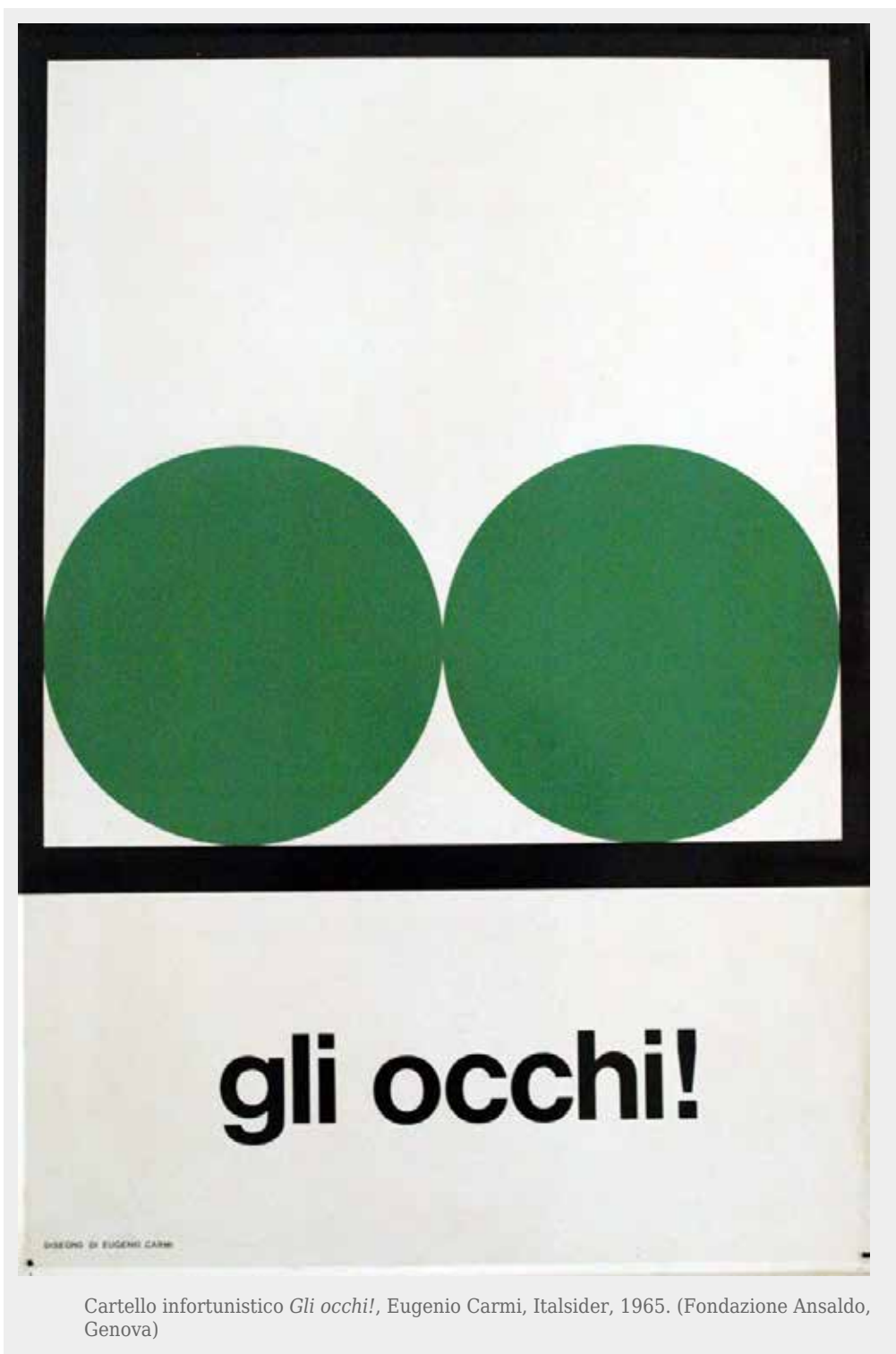
Cartello infortunistico Gli occhi! , Eugenio Carmi, Italsider, 1965. (Fondazione Ansaldo, Genova)