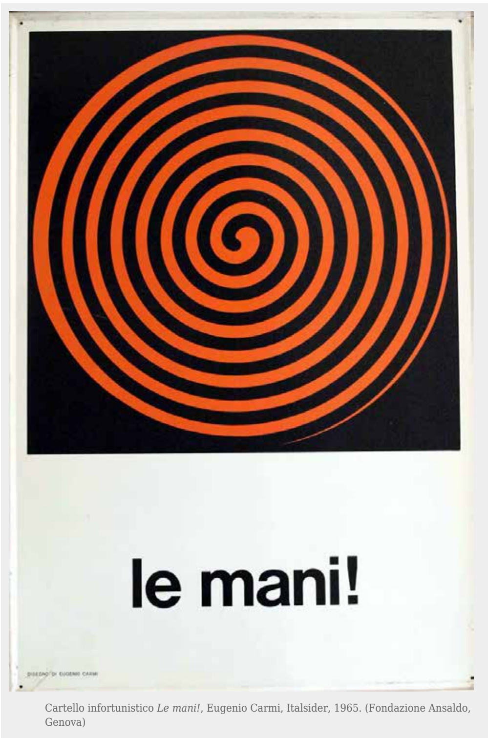
Cartello infortunistico Le mani! , Eugenio Carmi, Italsider, 1965. (Fondazione Ansaldo, Genova)