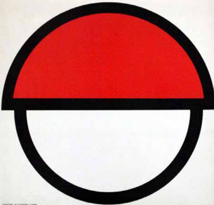
Cartello infortunistico La testa! , Eugenio Carmi, Italsider, 1965.