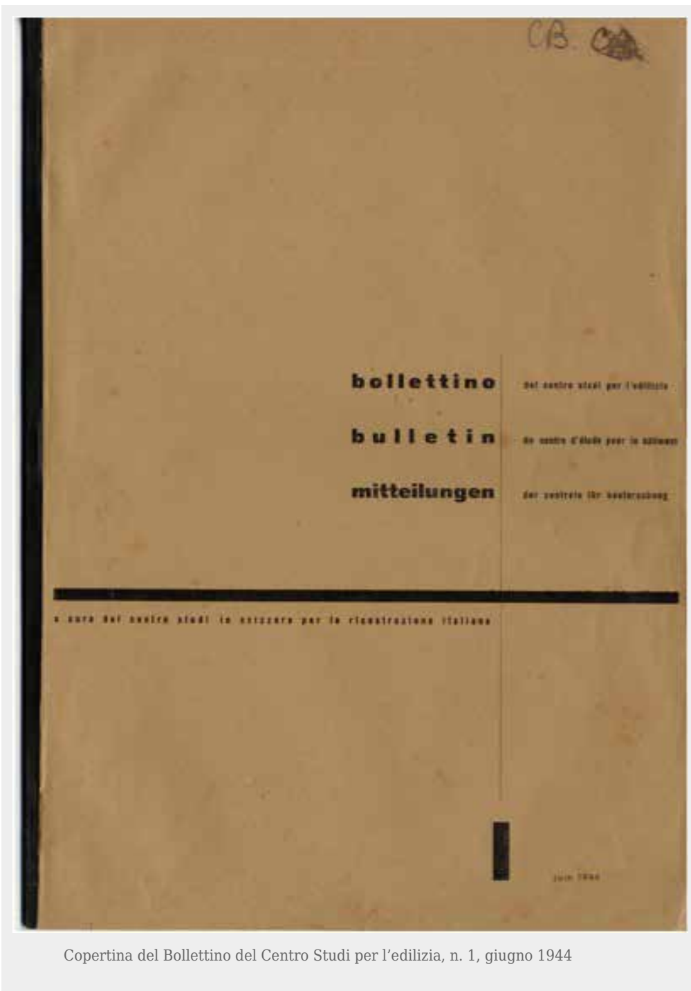
Copertina del Bollettino del Centro Studi per l'edilizia, n. 1, giugno 1944